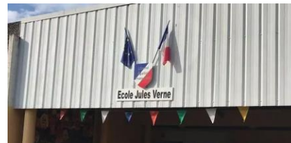
Les symboles républicains dans les écoles – page internet académie de Normandie