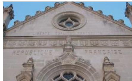
La loi de 1905 – fiches thématiques du site Vie publique