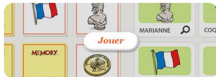
Les jeux 6-12 ans sur le site Junior Sénat