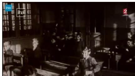
L'histoire de la laïcité en France – vidéo Ina de 4 min