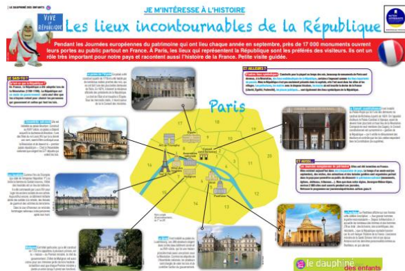
La ville de Paris : lieux incontournables de la République