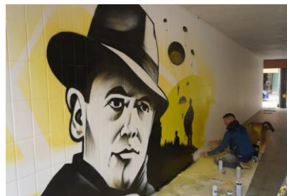
Frise historique sous forme de fresque à Albertville