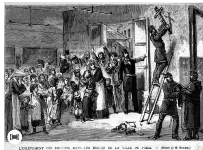
L'histoire par l'image – 9 propositions pour la laïcité

Les ressources Eduscol – volet questionner le monde (histoire)