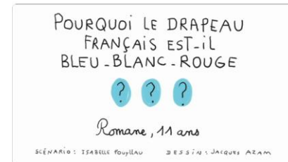
Vidéo Lumni 1min 42