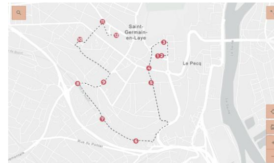
La ville de Saint-Germain-en-Laye : un parcours de dessins qui met en valeur 12 femmes illustres liées à la commune