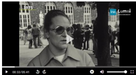
Laïcité à l'école : 50 ans de témoignages – vidéo Lumni de 5 min 41