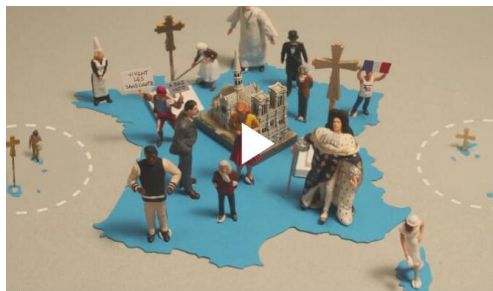
Les clés de la laïcité – vidéo Lumni de 13 min 58