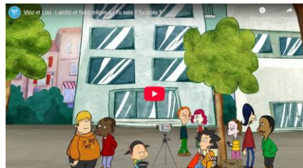
Laïcité et faits religieux – vidéo Canopé de 2 min