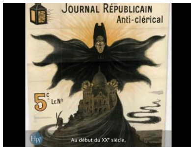
La loi de 1905 – vidéo Lumni de 4 min 11