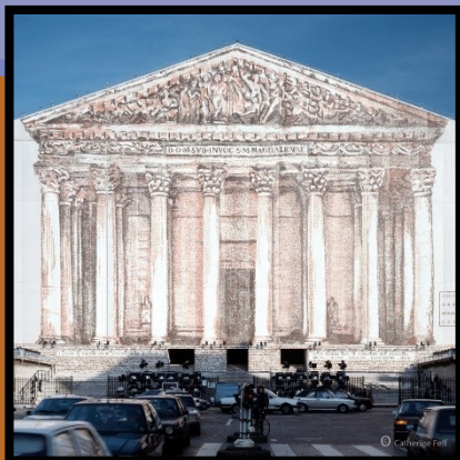
Bâche de protection en trompe-l'œil couvrant la façade de la Madeleine, 1992. Surface : 1400m 2 , 43m par 30m, ton sépia. Maîtres d'œuvre : Abciss, Actim, Fouassin, Lebourgeois, Serau.