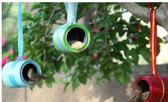
DES MANGEOIRES POUR LES OISEAUX