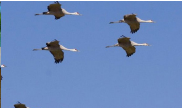
POURQUOI LES OISEAUX MIGRENT-ILS