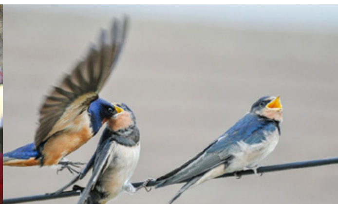
NOS OISEAUX EN VOIE DE DISPARITION